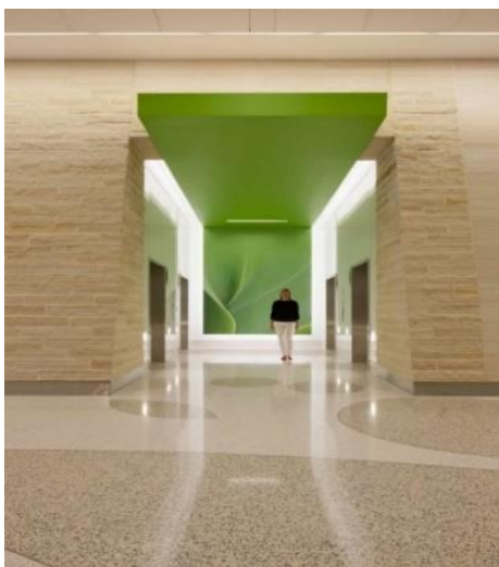
شکل ۱۳. راهرو بیمارستان کودکان Nemours در آمریکا (۱۱)