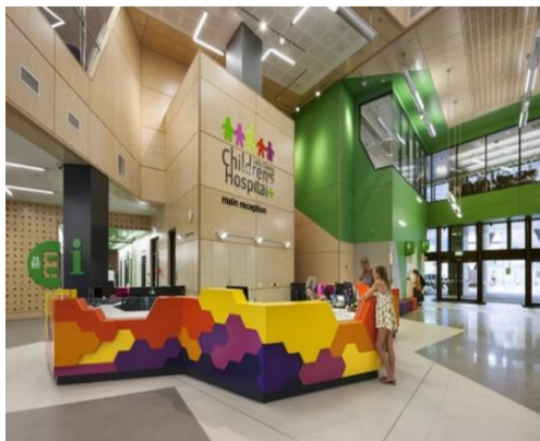
شکل ۱۰. پذیرش بیمارستان کودکان لیدی کایلنتو در استرالیا (۱۷)