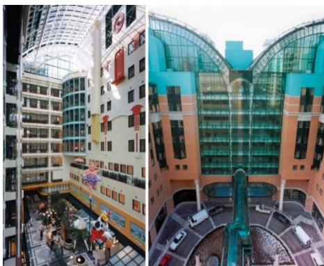
شکل ۵. آتریوم و لابی بیمارستان کودکان سیک کیدز در کانادا (۱۴)

گروه دوم شکل‌ها (شکل ۵ الی ۸): مربوط به لابی بیمارستان‌های کودکان بود که به تفسیر گزارش کودکان با دیدن هر شکل پرداخته می‌شود: تعداد زیادی از آن‌ها پس از دیدن شکل ۵ کمی دچار ابهام شدند و فضای آتریوم را خیلی درک نکردند. پس از توضیحات بیشتر در رابطه با آتریوم و نشان دادن فیلم و عکس‌های بیشتر از فضای آن دوست داشتند این محیط را تجربه کنند؛ البته برای آن‌ها این فضا ناآشنا بود. بسیاری از آن‌ها پس از مشاهده شکل ۶ بیان کردند که این رنگ‌ها و وسایل کودکانه را دوست داشتند و ترجیح می‌دهند مدت‌زمان بیشتری را در این فضا سپری کرده و سرگرم شوند. تعداد