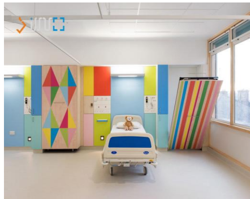
شکل ۱۷. اتاق بستری بیمارستان کودکان در انگلستان (۲۰)

گروه پنجم شکل‌ها (شکل ۱۷ الی ۲۰): مربوط به اتاق‌های بستری بود که به تفسیر گزارش کودکان در رابطه با هر شکل پرداخته شده است. بیشتر کودکان با دیدن شکل ۱۷ اظهار داشتند که این اتاق را بیشتر از سایر اتاق‌ها دوست دارند؛ چون رنگ‌های مختلفی در آن به کار رفته است. با دیدن شکل ۱۸ بیان کردند: «ما اینجا نمی‌توانیم اتاقی برای خودمان داشته باشیم تا وسایلمان را در آنجا قرار دهیم و به‌خوبی نمی‌توانیم فضای بیرون را از پنجره ببینیم» (کودک شماره ۸، ۹، ۱۰):