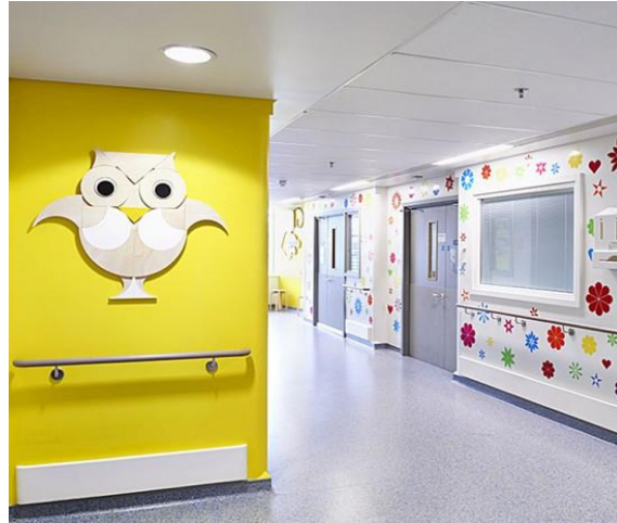
شکل ۱۶. راهرو بیمارستان کودکان در لندن (۱۹)

اما در مقابل شکل ۱۹ اتاقی را نشان داد که چیدمان آن کاملاً کودکانه و مشابه اتاق خودشان در خانه بود و به آن‌ها حس تعلق به مکان را القا کرد. بسیاری از آن‌ها از شکل ۲۰ استقبال کردند؛ زیرا با دیدن تخت دوم در اتاق و توضیح اینکه تخت موجود می‌تواند برای والدین شما باشد تا در کنار شما بخوابند احساس رضایت بیشتری داشتند. پس از تحلیل تمامی داده‌ها دریافت شد که ۸۰ درصد کودکان اتاق‌های دارای نور طبیعی و رنگ مناسب و فضایی شبیه به خانه را انتخاب می‌کنند.