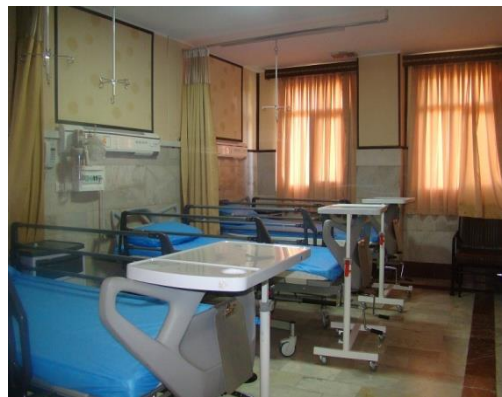
شکل ۱۸. اتاق بستری بیمارستان تأمین اجتماعی سندج (۲۱)