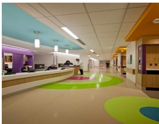
شکل ۱۱. پذیرش بیمارستان کودکان Nemours در آمریکا (۱۱)