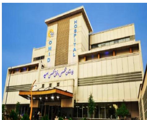
شکل ۴. نمای بیمارستان امید اصفهان (نویسندگان، ۱۳۹۷)

دیگری از آن‌ها بیان داشتند شکل ۷ فضایی دوست‌داشتنی نیست و تمایلی به چنین محیطی ندارند و جذابیتی برایشان نداشت. در رابطه با شکل ۸ اظهار داشتند که این فضا به دلیل داشتن نورهای رنگی و ایجاد سرگرمی برای آن‌ها بسیار زیبا و دوست‌داشتنی است. در نهایت با توجه به گفته‌های کودکان و تحلیل آن‌ها این مسئله دریافت شد که ۵۵ درصد کودکان لابی‌های دارای آتریوم با نور طبیعی کافی و ۳۵ درصد آن‌ها لابی‌هایی با رنگ‌های متنوع و فضای کودکانه را انتخاب می‌کنند.