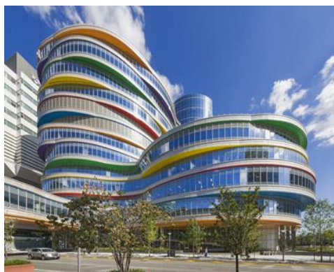
شکل ۲. نمای بیمارستان کودکان در غرب فیلادلفیا (۱۲)