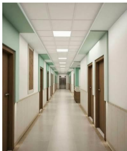
شکل ۱۵. راهرو بیمارستان کودکان در مشهد (۱۸)