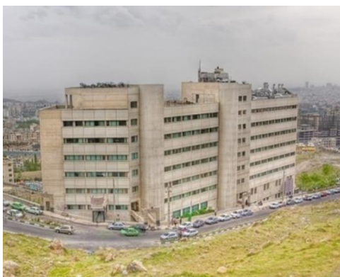
شکل ۳. نمای بیمارستان کودکان محک در تهران (۱۳)