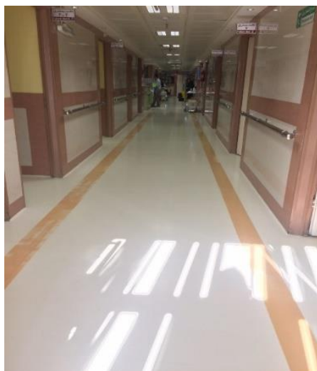
شکل ۱۴. راهرو بیمارستان کودکان امید در اصفهان (نویسندگان، ۱۳۹۷)