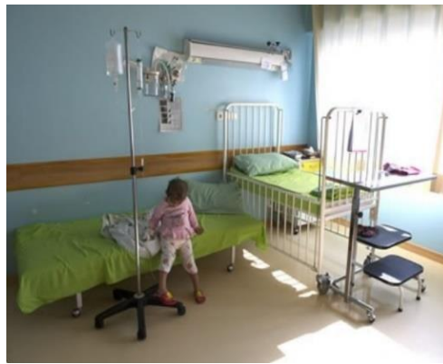
شکل ۲۰. اتاق بستری بیمارستان کودکان محک در تهران (۱۳)