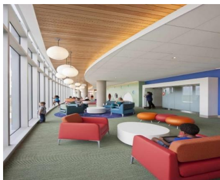
شکل ۷. لابی بیمارستان کودکان Nemours در آمریکا (۱۱)