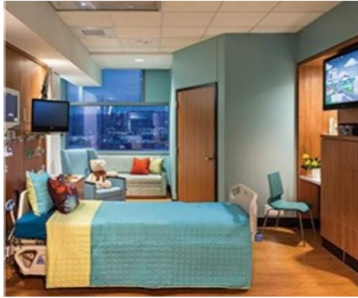
شکل ۱۹. اتاق بستری بیمارستان کودکان بنجامین راسل در آمریکا (۲۲)