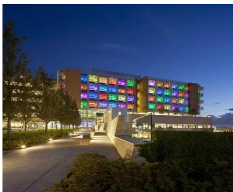
شکل ۱. نمای بیمارستان کودکان Nemours در آمریکا (۱۱)

به‌علاوه استفاده از رنگ‌های گرم و قهوه‌ای در راهروها و طولانی‌بودن آن‌ها برای کودکان خسته‌کننده و استرس‌زا بود. اتاق‌های بستری به‌گونه‌ای طراحی نشده‌اند که کودکان حس راحتی و آرامش داشته باشند و فضایی مشابه فضای خانه برایشان تداعی شود. همچنین رنگ زرد به‌کاررفته در اتاق بستری حس کسالت و بیماری را تشدید می‌کند. برای مثال مادر یکی از کودکان بستری‌شده اظهار داشت: «دخترم از تنهاماندن در اتاق بستری می‌ترسید و همیشه اصرار داشت که من در کنارش باشم» (والد شماره ۳). طبق جدول ۱ می‌توان چنین نتیجه گرفت که عوامل محیطی و نیز نمای ورودی و لابی و پذیرش بیمارستان که اولین تماس کودک در بدو ورود به بیمارستان محسوب شده، می‌تواند موجب القای حس استرس در کودک بیمار در ابتدای ورود به بیمارستان باشد. همچنین کودک بیمار به دلیل آنکه اکثر مدت بستری‌شدن در بیمارستان را در اتاق بستری سپری می‌کند، طراحی