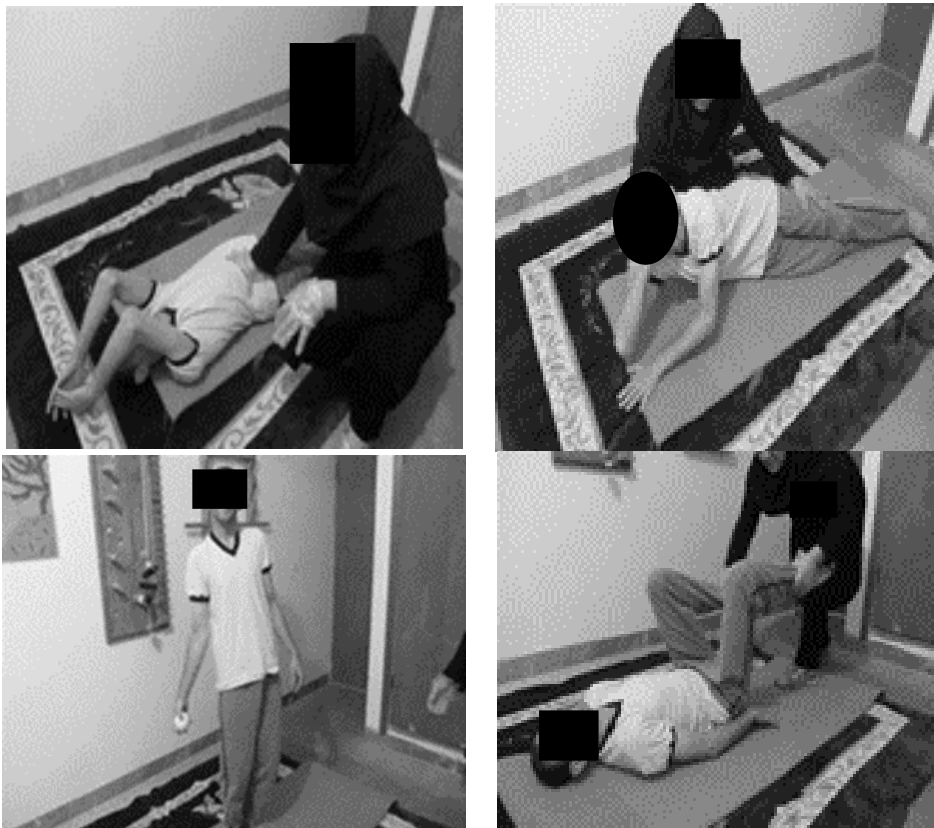
شکل ۳. نمونه‌های اجرای تمرینات اصلاحی کمکی و نظارت مستقیم محقق بر تمرین‌دهنده‌ها

در این برنامه تمرینی، حرکات کششی از هفت ثانیه در هفته اول به بیست ثانیه در هر تکرار تمرینی در هفته پایانی افزایش یافت. تمرینات تقویتی ایزومتریک نیز از مدت زمان هفت ثانیه انقباض ایستا در شروع پروتکل، به پانزده ثانیه در انتهای دوره تمرینات رسید. اصول پیشرفت تدریجی تمرینات و رعایت اصل اضافه بار براساس پیشرفت هر آزمودنی در فرایند تمرینات اصلاحی و بررسی شرایط فردی هر یک از