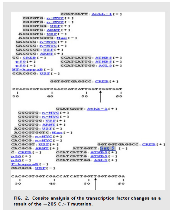
FIG. 2. Consite analysis of the transcription factor changes as a result of the -205 C > T mutation.

شکل ۱- نتایج آنالیز Consite در مورد تغییرات فاکتورهای رونویسی در نتیجه جهش ۲۰۵- در پروموتور ژن کلرتیکولین