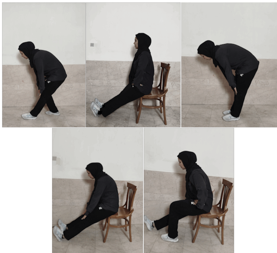
شکل ۱. تمرینات کششی

نکته شایان توجه آن است که اگر زاویه مفصل بیش از ۸۰ درجه باشد، افزایش طول همسترینگ را نشان می دهد و در صورتی که تیلت خلفی بیش از ۱۰ درجه باشد و ران در حدود ۸۰ درجه بالا برده شود، بیانگر کاهش طول همسترینگ ها است؛ به همین علت برای جلوگیری از تیلت خلفی و فلکشن کمری بیش از حد، ثابت نگه داشتن لگن در حالت صاف بودن کمر (با محکم نگه داشتن پای مقابل روی تخت) ضرورت دارد. در صورت کوتاه بودن طول عضلات همسترینگ، زاویه ای که ران با تخت می سازد کمتر از ۸۰ درجه است؛ پس اگر زاویه SLR همچنان ۸۰ درجه باشد ولی کمر هایپرلوردوزیس (گودی کمر افزایش یافته) داشته باشد، این مسئله بیانگر افزایش طول همسترینگ ها است (۱۰،۲۰). استفاده از گونیامتر Sammons Preston برای اندازه گیری دامنه حرکتی زاویه مفصل ران در آزمون SLR برای تعیین کوتاهی عضله همسترینگ با دقت ۰/۹۸ درصد برآورد شد؛ از سویی دیگر، در اندازه گیری قدرت ایزومتریک در اندام تحتانی، میزان اعتبار و روایی