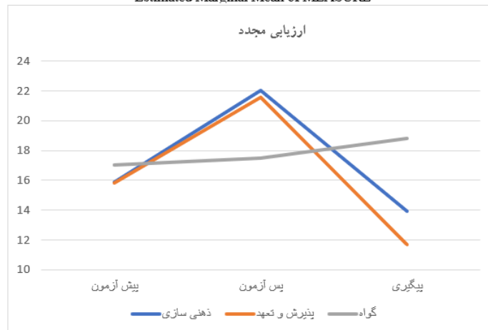
شکل ۱. نمودار پروفایل پلات مربوط به اثرات گروه و زمان متغیر ارزیابی مجدد