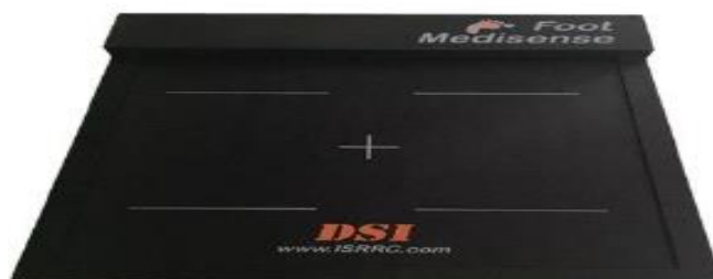
شکل ۱. دستگاه فوت مدیسنس

راست و بار دیگر پای چپ روی دستگاه قرار می‌گرفت. پس از سه دقیقه استراحت، هر فرد برای اجرای مداخله، دو بار همین مسیر را با اجرای هم‌زمان تکلیف شناختی طی کرد. برای اجرای پس‌آزمون، سه مرحله با سطح دشواری متفاوت به صورت تصادفی منظور شده بود: مرحله یک، شمارش معکوس به صورت دو عدد در میان، از عدد ۴۵ تا پایان مسیر؛ مرحله دوم، شمارش معکوس از عدد ۶۰ به صورت سه عدد در میان تا پایان مسیر (یعنی ۶۰-۵۷-۵۴-۵۱...) و مرحله