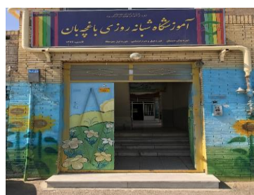
تصاویر ۱ و ۲. ورودی مدرسه دخترانه باغچه‌بان

در مدرسه صدریه به جای استفاده از روزنه کوچک در داخل درب، به‌طور کامل از درهای شیشه‌ای استفاده شده است. طبق مطالب مطرح شده توسط باتود و آشا شامل استفاده از درهای شیشه‌ای و شفاف و استفاده از جان‌پناه شیشه‌ای و درهای اتوماتیک (۷)، باید گفت در این زمینه نیز این نکات به صورت کامل رعایت نشده است.