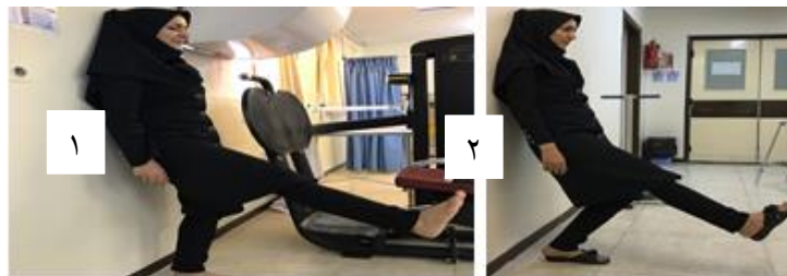
شکل ۴. گروه تمرینات ثبات مرکزی، تمرین اسکات یک پا با تکیه به دیوار. ابتدا به دیوار تکیه داده و یک پا از پاها را با زانوی اکستند بالا نگه داشته است (۱). با کمک دیوار زانوی پای روی زمین را خم کرده است (۲).