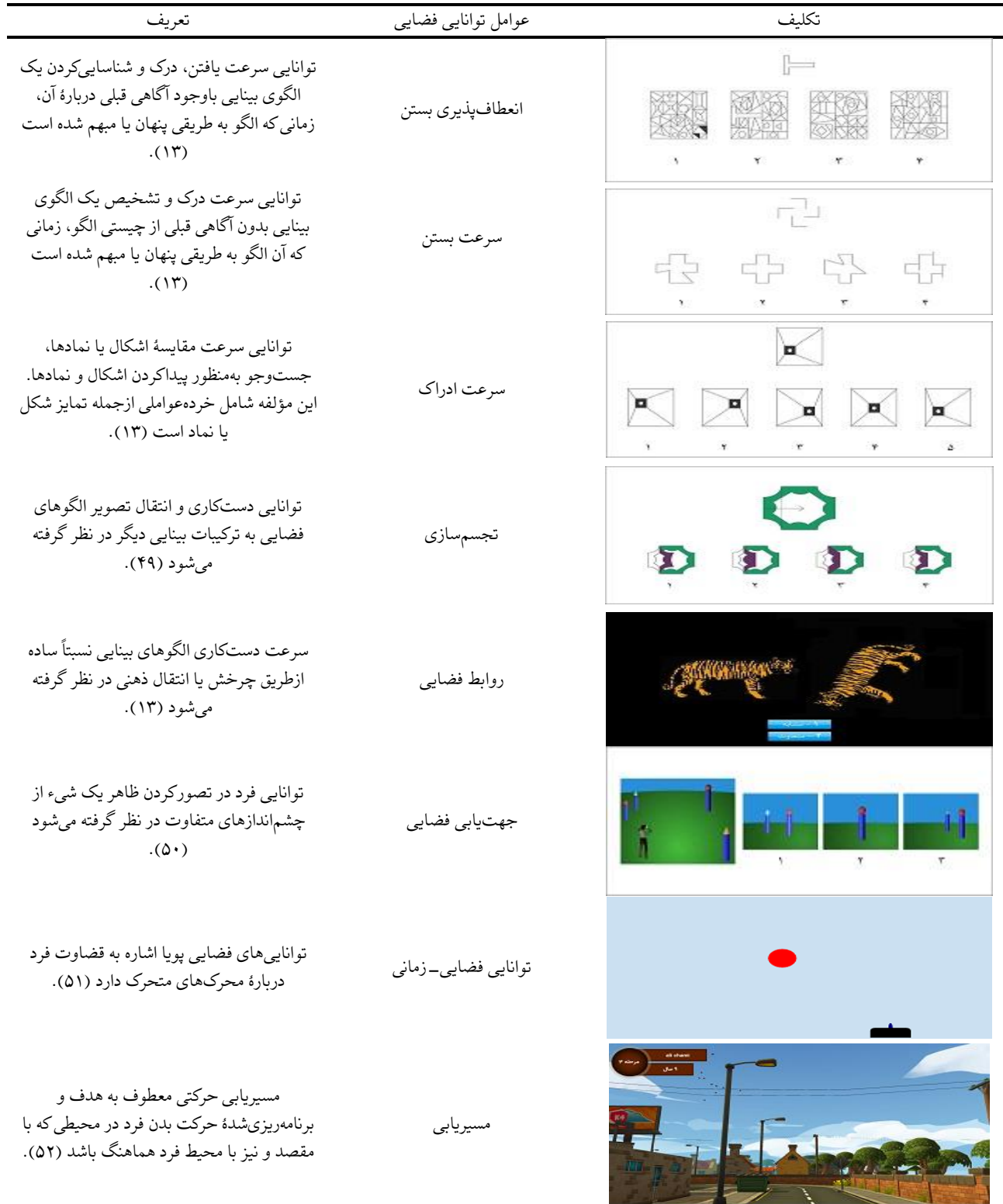
جدول ۱. تعریف عوامل توانایی فضایی

صفحه‌کلید به این هدف ضربه بزند. با این ضربه شیء مثلی شکل که موشک نام دارد، شروع به حرکت مستقیم به سمت بالا می‌کند. آزمودنی تلاش می‌نماید که راه‌اندازی موشک را زمان‌بندی کند؛ به طوری که موشک در گوشه بالا سمت راست به هدف برخورد کند. آزمون در مجموع ۲۱ ماده دارد. قبل از ارائه ماده اصلی پنج آیت تمیزی با