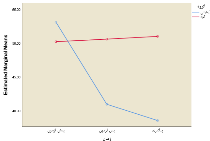
نمودار ۲. مقایسه میانگین نمره افکار اضطرابی در گروه‌های آزمایش و گواه در پیش‌آزمون، پس‌آزمون و پیگیری