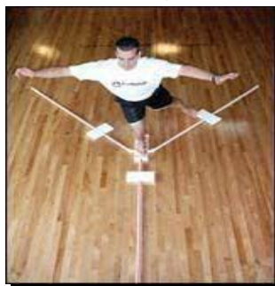
شکل ۱. تست تعادل Y

آزمون را در جهت عقربه‌های ساعت انجام داد. برای اجرای آزمون، آزمودنی با پای برتر در مرکز دستگاه ایستاد و با پای دیگر قسمت متحرک را تا آنجا که خطا نکند، به جلو راند و سپس به حالت طبیعی روی دو پا برگشت. خطاها شامل این بود که پا از مرکز دستگاه حرکت نداشته باشد، روی پای که عمل دستیابی را انجام داده تکیه نکند یا آزمودنی نیفتد. فاصله قسمت متحرک تا مرکز دستگاه فاصله دستیابی است. آزمودنی سه بار آزمون را انجام داد و آزمونگر میانگین دستیابی در هریک از جهات را اندازه‌گیری کرد و بر طول پا (برحسب سانتی‌متر) تقسیم و در ۱۰۰ ضرب نمود تا فاصله دستیابی برحسب درصد اندازه طول پا در هریک از سه جهت به دست آید. از جمع اعداد حاصل و تقسیم آن به عدد ۳، امتیاز ترکیبی آزمودنی محاسبه شد (۳۰) (شکل ۱).