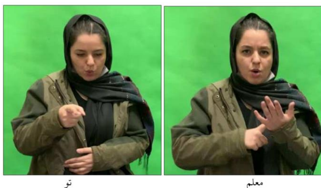
شکل ۱. ساخت مالکیت با مالک ضمیری: معلم تو

مالکیت انتسابی در زبان اشاره ایرانی: در این ساخت، رابطه مالک و مایملک را می‌توان به صورت گروه اسمی بیان کرد و مالک می‌تواند اسم یا ضمیر باشد. یافته‌های پژوهش نشان دادند که در زبان اشاره ایرانی امکان استفاده از ضمایر شخصی منفصل در ساخت‌های اضافی (مانند معلم تو) هست و در این پژوهش هیچ‌گونه مجموعه جداگانه‌ای