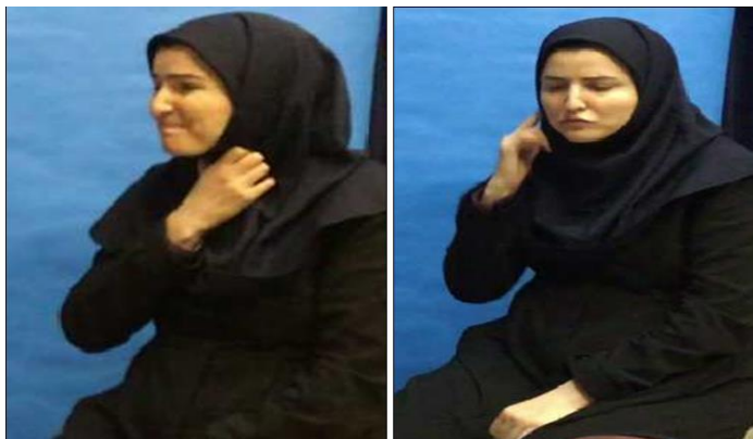
شکل ۱۵. نشان دادن گوش و گلو روی بدن خود اشاره‌گر، بیانگر مفهوم مالکیت، اول شخص: گلوئی من (گلووم) یا گوش من (گوشم)

- نشانه‌گذاری فضای اشاره‌ای در ساخت مالکیت: در زبان اشاره ایرانی، سازوکار استفاده از فضای اشاره‌ای در ساخت مالکیت وجود دارد. این موضوع در چند نمونه زیر شرح داده می‌شود. معمولاً اشاره‌گران وقتی می‌خواهند اندام‌های بدن یا وجود دردی را در نقطه‌ای از بدن خود نشان دهند، بعد از اشاره مرتبط (که مایملک محسوب می‌شود) از ضمیر شخصی «من» در مفهوم مالکیت استفاده نمی‌کنند و صرفاً نشان دادن