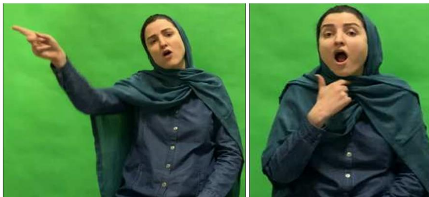
شکل ۳. ساخت مالکیت با مالک ضمیری: فکر آنها (ضمیر آنها در دو حالت نشان داده شد، تفاوتی در تغییر مفهوم و ساخت مشاهده نشد)