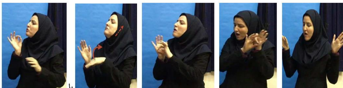
شکل ۱۳. ساخت-داشتن/نداشت: الف- پروانه (روى بال) خال (روى بال) خال دارد/هست. ب- پروانه (روى بال) خال (روى بال) خال ندارد/نیست.

می‌شود. تغییر جایگاه مالک و مایملک در مقایسه با ساخت «داشتن» مشهود است (شکل ۱۴). استفاده از این ساخت برای مالکیت انتقال‌ناپذیر و انتزاعی در داده‌های این پژوهش مشاهده نشد.