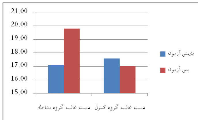
نمودار ۱- میانگین امتیازات دست غالب گروه‌ها حاصل از اجرای آزمون جعبه و مکعب

شروع جلسات مداخله تقاضانامه‌ای جهت استحضار و توافق والدین یا مراقبین افراد مورد مطالعه- با در نظر گرفتن ضوابط آموزشی و همکاری مدیران آموزشگاه‌ها- تهیه گردید. سپس جلسه‌ای با حضور والدین تشکیل گردیده و در مورد نحوه انجام مداخله، اصول و فواید موسیقی درمانی و بی خطر بودن مداخله به طور کامل بحث و تبادل نظر شد. آزمودنی‌ها و والدین اختیار کامل داشتند که هرگاه تمایل به همکاری نداشتند، از ادامه کار خودداری نمایند. پس از اتمام مداخله، به همه آزمودنی‌ها، بسته‌ای حاوی یک نسخه از موسیقی استفاده شده به همراه جزوه آموزشی و یک هدیه مناسب اهداء گردید. جهت تعیین نرمال بودن توزیع امتیازات و مشخصه‌های جمعیت شناختی و نیز تعیین نوع آزمون‌ها (پارامتری یا ناپارامتری) از آزمون تک متغیری کولموگوروف- اسمیرنف (One-Sample Kolmogorov-Smirnov Test) استفاده گردید؛ و با توجه به نرمال نبودن توزیع‌ها، برای تحلیل یافته‌ها از دو آزمون ناپارامتری یو-من- ویتنی (U Mann-