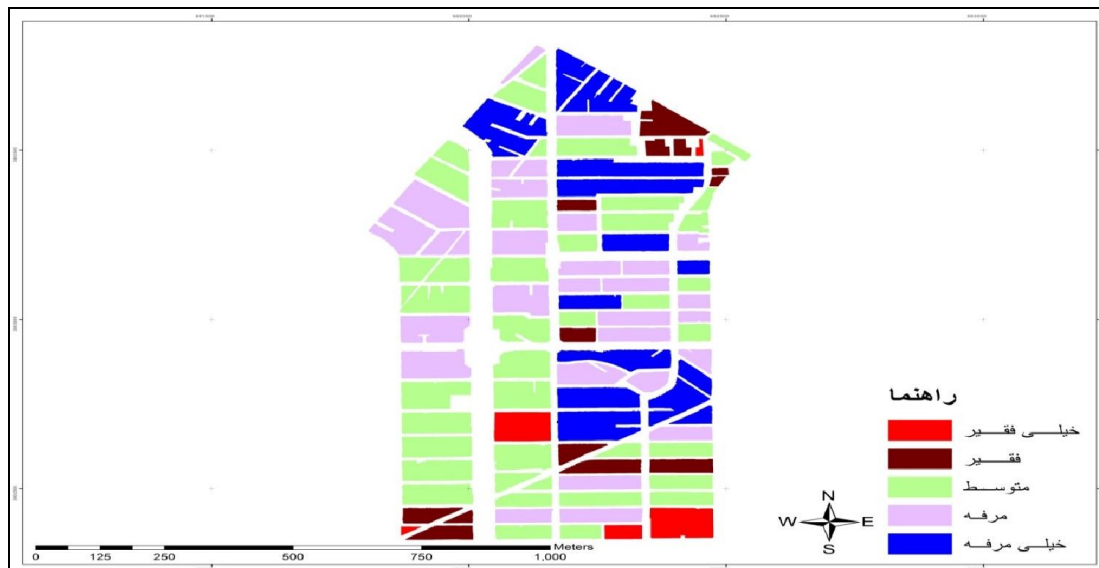
نقشه ۳. پهنه‌بندی فقر در بلوک‌های محله ۲۲ بهمن، با توجه به تلفیق عوامل چهارگانه، در سال ۱۳۸۵