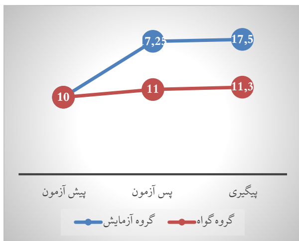
نمودار ۲. میانگین کارکردهای نوشتن گروه‌های آزمایش و گواه در سه زمان

باتوجه به جدول و نمودار ۱، در متغیر مهارت‌های خوانداری، در مرحله پیش آزمون پس آزمون ( P < 0.001 ) و پیش آزمون - پیگیری ( P < 0.001 ) با در نظر گرفتن نوع عضویت گروهی شرکت کنندگان، تفاوت معناداری مشاهده می‌شود که بیانگر افزایش مهارت خوانداری گروه آزمایشی نسبت به گروه گواه بود. همچنین در مرحله پیگیری باتوجه به عضویت گروهی شرکت کنندگان، تفاوت معناداری در مقایسه با مرحله پس آزمون مشاهده نشد ( P > 0.05 ) که بیانگر پایداری دستاوردهای آموزشی است. همچنین داده‌های جدول ۱ و نمودار ۲ نیز نمایانگر وجود تفاوت معنادار بین مهارت‌های نوشتاری