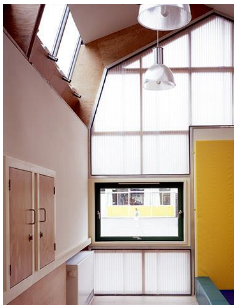
تصویر ۱. استفاده از شیشه سندبلاست (۱۵)