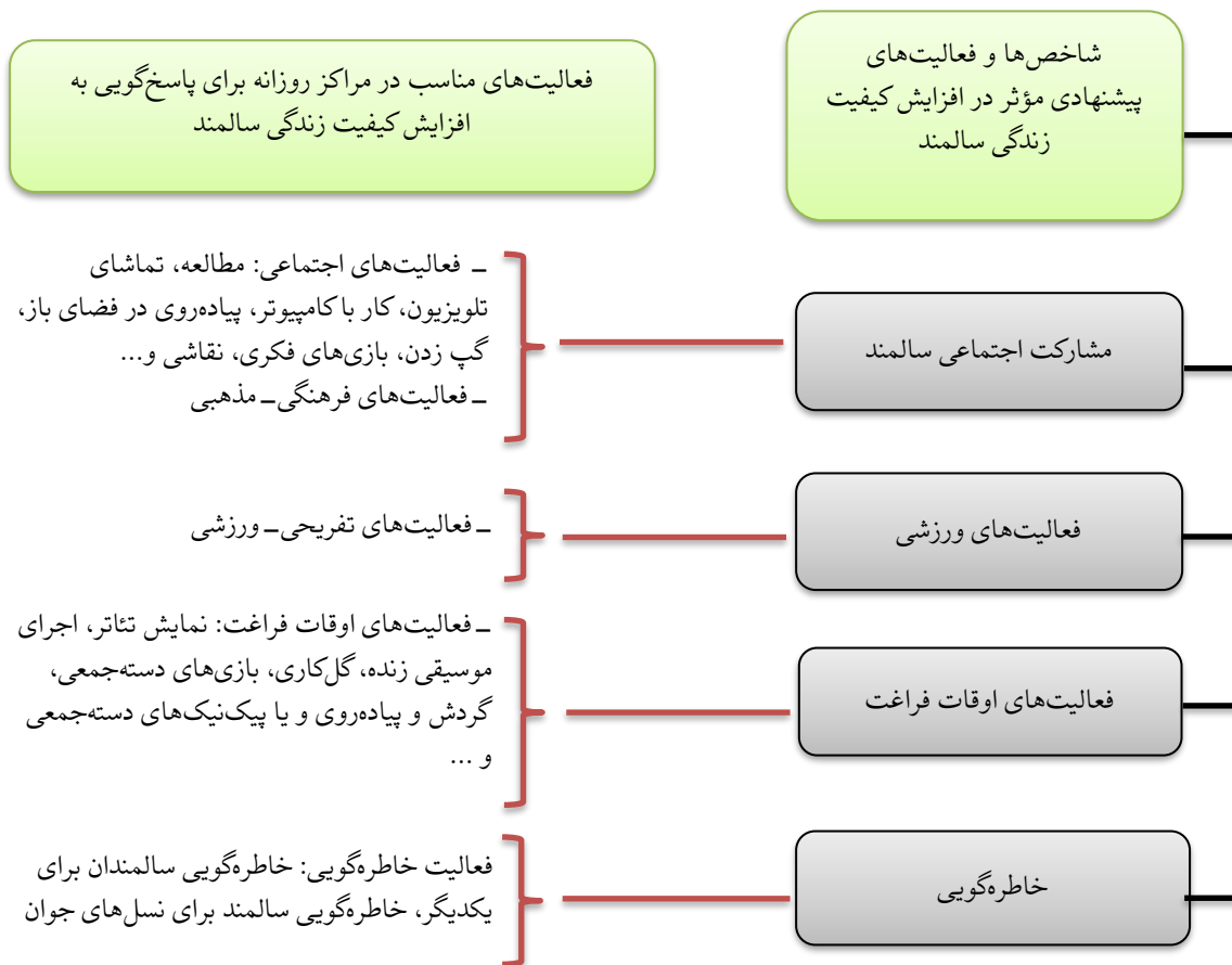
نمودار ۲. شماتیک شاخص‌ها و فعالیت‌های پیشنهادی برای افزایش کیفیت زندگی سالمندان (مأخذ: نگارندگان)